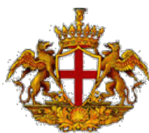
COMUNE DI GENOVA